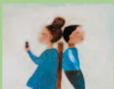
TIENER EN JONGEREN