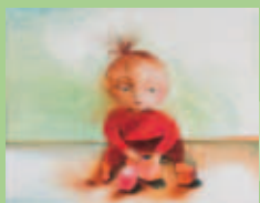
PEUTER EN KLEUTER